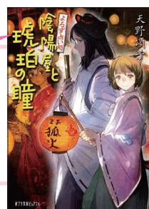
『よろず占い処 陰陽屋と琥珀の瞳』