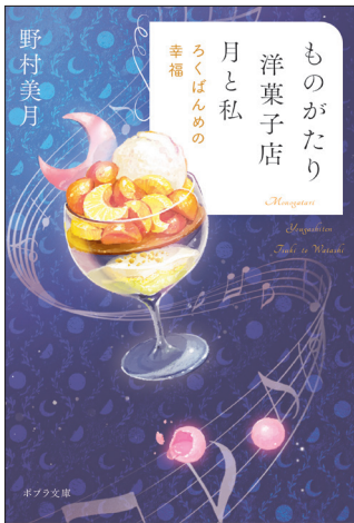
装画 ● コロリス